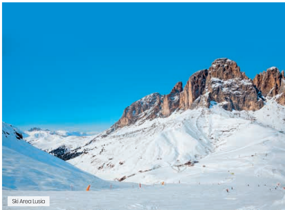
Ski Area Lusia